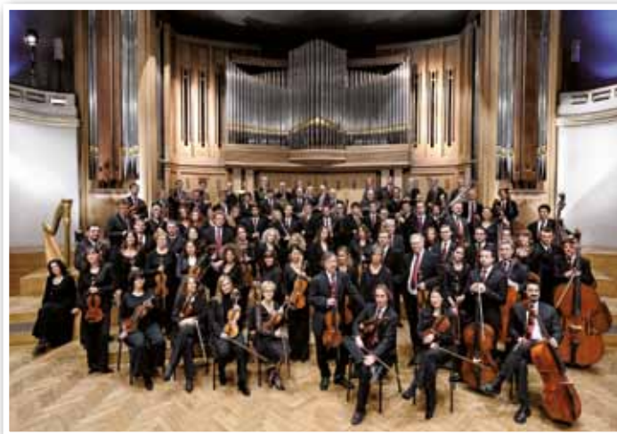
ONB © Wim Van Eesbeeck

Tous les soirs à 20.00, place au concert ! Les auditeurs de Musiq'3 ont rendez-vous avec les solistes, les chefs et les orchestres les plus prestigieux. Chaque semaine : cinq concerts, en direct ou en différé. Des affiches très variées : du récital au concert symphonique (de l'ONB, de l'OPRL ou des plus grands orchestres internationaux), en passant par la musique de chambre ou encore vocale... Producteurs en alternance.